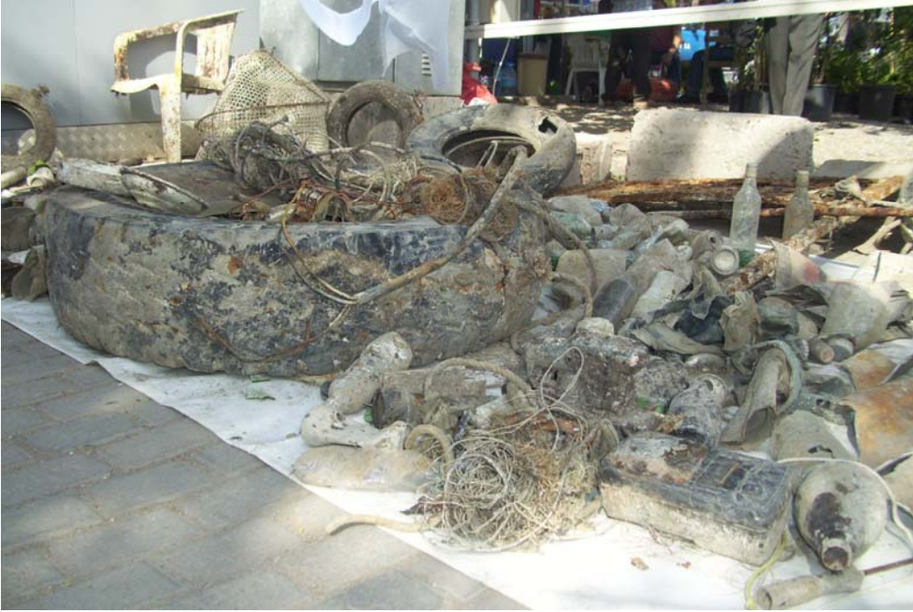
Fotoğraf 5: Sualtı temizlik etkinliğinden çıkan atıkların sergisi.