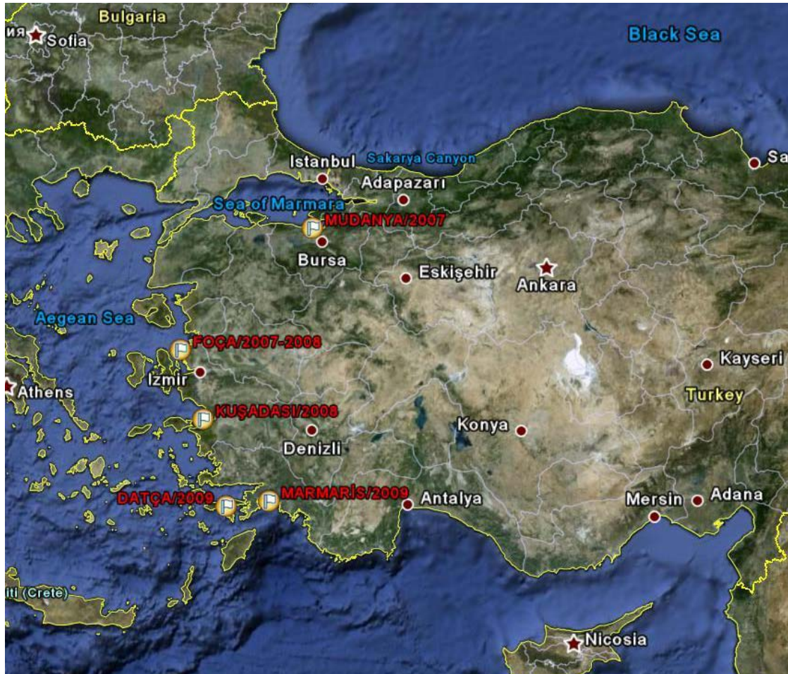
Şekil 1: 2007 yılından itibaren Kıyı Günü etkinliklerinin düzenlendiği yerler.

Önceki yıldan edinilen yerel deneyimlerden faydalanmak ve merkezde Genel Müdürlük tarafından yürütülen koordinasyonu güçlendirmek amacıyla 2008 yılı Kıyı Günü kutlamaları yine Foça'da düzenlenmiştir. Genel Müdürlük'ün ilk defa koordinasyonunda gerçekleştirilen etkinliklerde Foça Belediyesi yine önemli bir rol üstlenmiş ve SAD'nin de destek verdiği organizasyonun etkinliğinde ciddi bir artış gözlenmiştir. 2008 yılında Kuşadası Belediyesi de Genel Müdürlük'ün koordinasyonunda kendi imkanları ile 24 Ekim'de Kıyı Günü etkinliği düzenlemiştir.