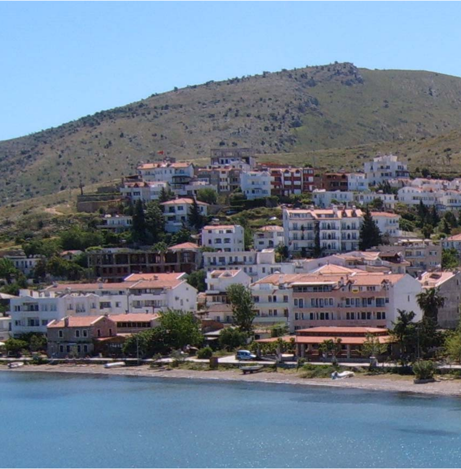
DATÇA, MUĞLA, TÜRKİYE